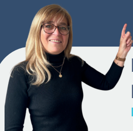
France HOUSSAYE DCR ROUEN

"C'est avec beaucoup d'enthousiasme et d'humilité que nous nous présentons à cette élection avec pour ambition première de porter la voix et les intérêts des salariés sans jamais ignorer ceux de l'entreprise et faire en sorte que personne ne soit laissé de côté".